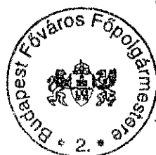
Tarlós István főpolgármester